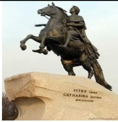
А. Медный всадник