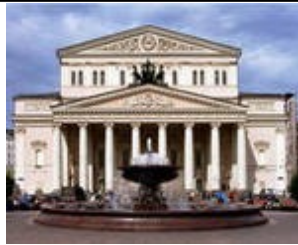
Б. Большой театр