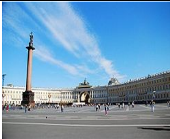
Г. Дворцовая площадь

6. Выбери правило, которое необходимо соблюдать пешеходам для безопасного движения по улице.